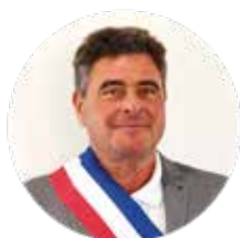
Éric LAMY Maire